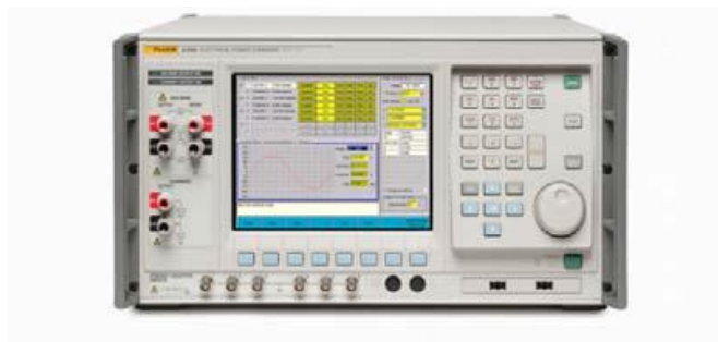
Рисунок 1 – Фотография общего вида калибраторов электрической мощности Fluke 6100В, 6105А.